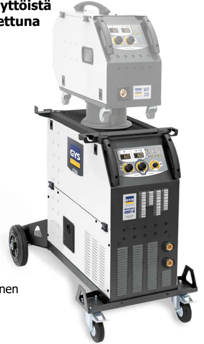
Toimitetaan ilman lisävarusteita, ilman erillistä langansyöttölaiteita.