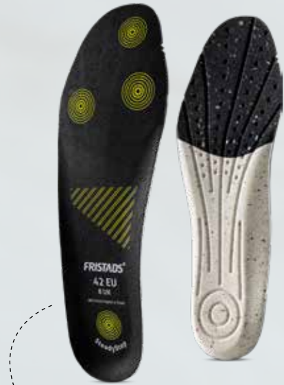
SteadyStep – 5 mm (myydään erikseen) Ihanteellinen seisomatyöhön ja koko päivän vakauteen.