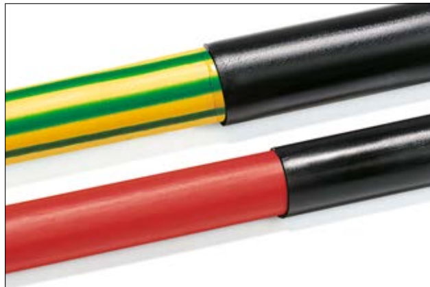
TA30- ja TA40- liimalliset kutistemuoviletkut.