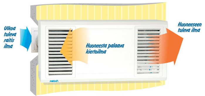
Kuvassa vasenkätinen (tuloilmakammio vasemmalla)