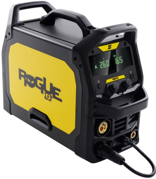
Rogue EM 180