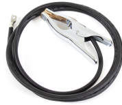
Earth return cable 3 m, 25 mm 2

220 A, kaasujäähdytteinen, 3 m, MinarcMig-liitin