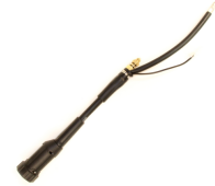
Euro Adapter for MinarcMig and MinarcMig Evo

MST 400 on kaksipyöräinen kuljetuskärry lähinnä pienemmille kaasupulloille.